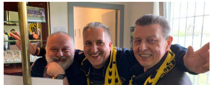
MSV-Liga-Fans in Vorfreude auf den Saisonstart

25.07.2021 14:00 Uhr - Deepenhorn 5, 22145 Hamburg Meiendorf (Oberliga) - Sasel 2. (Bezirksliga)