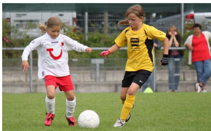
Spaß an der Bewegung für Groß und Klein