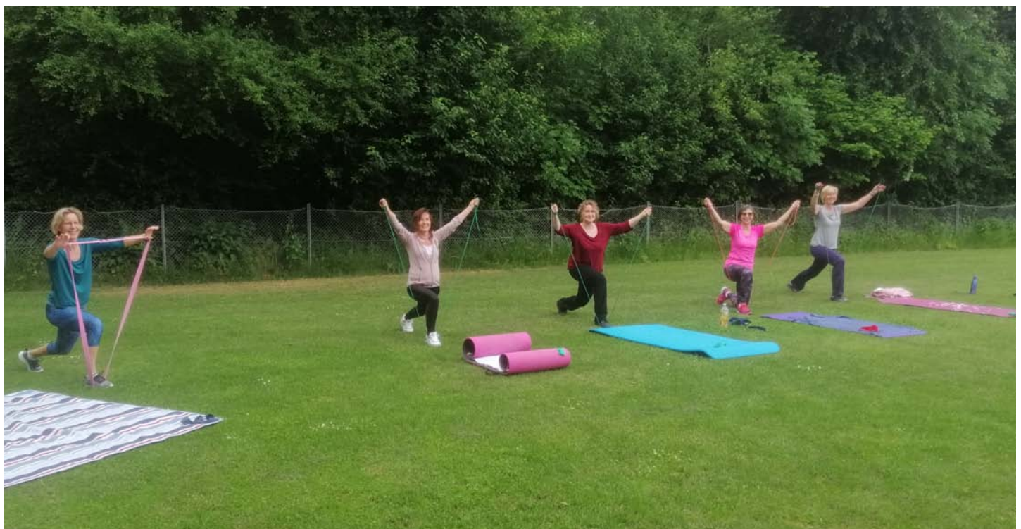
„Sportgruppe Draußen“ - Es geht wieder los im Meiendorfer Sportpark