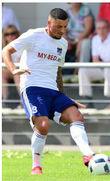
Auch für die "übermächtige" TuS Dassendorf war Tanovic in der Oberliga schon am Ball.

Beim MSV hat man sich „personell“ besser aufgestellt – und ich denke nicht, dass ich jetzt schief angeguckt werde, weil ich dorthin gehe.“ Vielmehr ist Tanovic der Überzeugung, dass Meiendorf in der kommenden Saison mit den Verstärkungen eine positive Überraschung darstellen könne. „Ich will immer gewinnen – und dafür gebe ich alles!“ Nun möchte er seinen Teil dazu beitragen, dass der Meiendorfer SV einen kleinen Höhenflug erlebt.