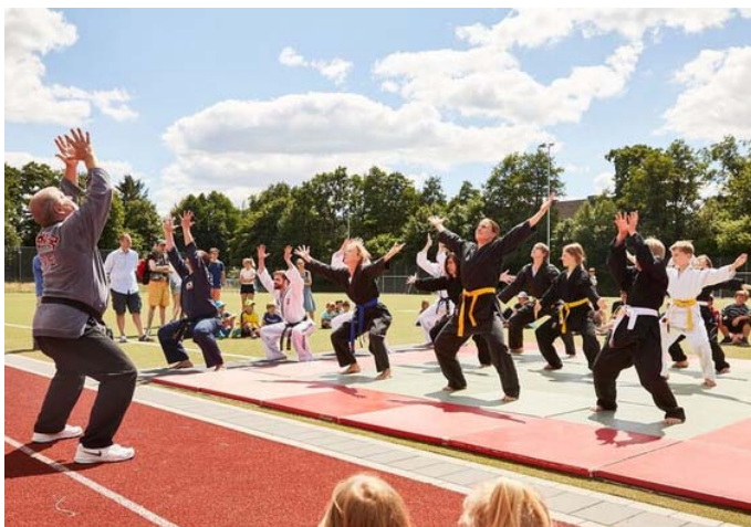
Sport im Freien kann so schön sein