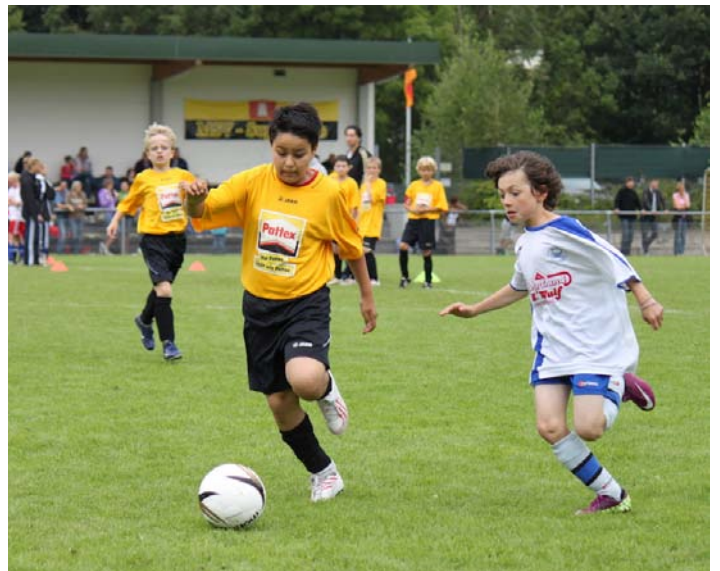
Endlich wieder Fußball auf'm Platz

Meyer: Ich kann es verstehen, weil man Anhaltspunkte