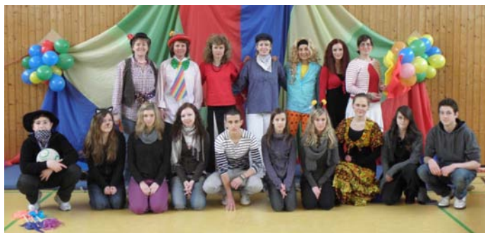
Die Übungsleiterinnen mit Helfern