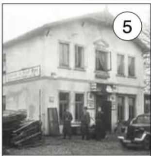
Abbildung 5: Um 1944 bei einem Luftangriff wurde der „Meiendorfer Park“ und die Kegelbahn getroffen!