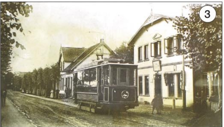
Abbildung 3: Um 1910: Die Kleinbahn aus Altrahlstedt Richtung Volksdorf an der Haltestelle Gasthof Offen (heute Hotel Meiendorfer Park)