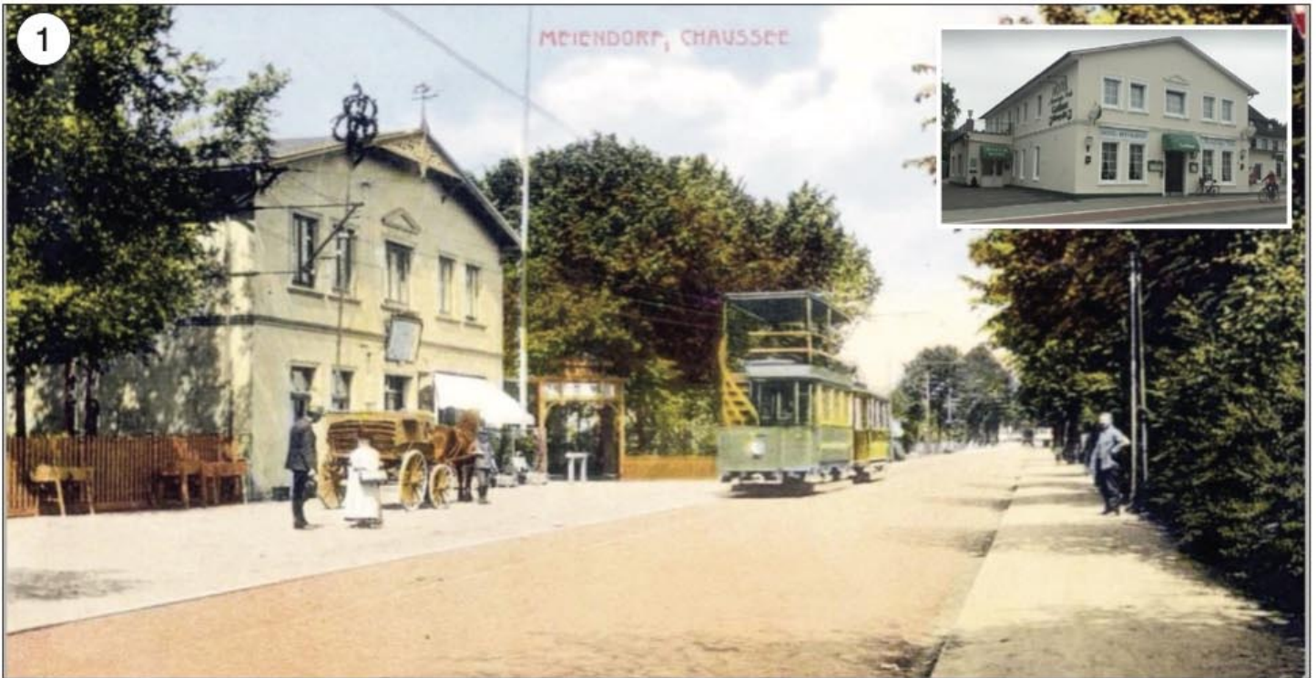
Abbildung 1: Die Gastwirtschaft und Hotel von W. Offen wurde 1892 an der Chaussee (Meiendorfer Straße) erbaut, später von Soetebier, Hans Christian, Riege, Walter Cordes und zuletzt von Meike und Jürgen Struck übernommen. Dieses Bild entstand um 1905-10 mit der Kleinbahn Richtung Alt-Rahlstedt. Das Gebäude hat sich bis heute nur wenig verändert. „Hotel Meiendorfer Park“ und Restaurant Malat (indische Küche - siehe kleines Bild oben rechts) - Fotos Archiv Gigar

Um 1900 bis weit in die 60er Jahre gehörte Meiendorf und Umgebung zu den Ausflugszielen der gestressten Hamburger und Wandsbeker. Zahlreiche Gaststätten und Ausflugslokale säumten die Meiendorfer Straße, Meiendorfer Weg und Umgebung. Zu erreichen waren die Lokale mit der damaligen Kleinbahn von Rahlstedt aus oder über die B75 mit Pferd und Kutsche.- Fotos Archiv