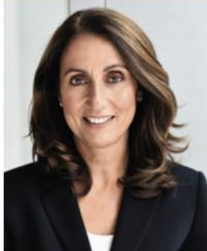
Aydan Özoğuz, Vizepräsidentin des Deutschen Bundestages Wandsbeker Zollstr. 15 • 22041 Hamburg Telefon: 68 94 45 45 E-Mail: aydan.oezoguz.wk@bundestag.de