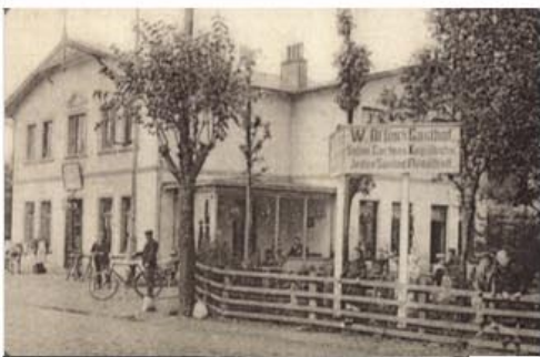
Abbildung 4: Um 1900: die Gäste sitzen vor dem Gasthof W.Offen an der Meiendorfer Straße am Pferdeausspann. Jeden Sonntag gab es einen Flügelball!?